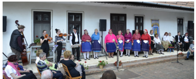
A Fóti Asszonykórus Fóton gyűjtött népdalt énekelt