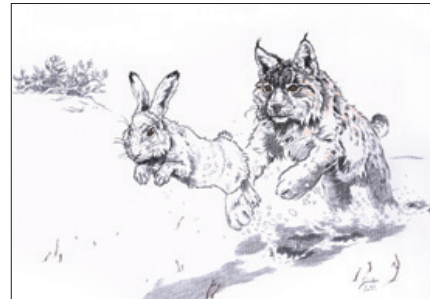
Sándor Róbert: Lerohanás

2023. június 16-ig, munkanapokon 9-18, szombaton 9-13 óráig.