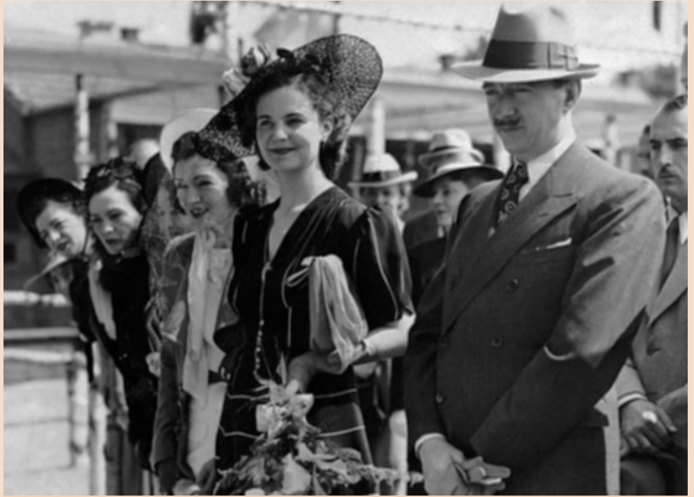
Száműzetésben: Gróf Apponyi Geraldine és férje, I. Zogu király lánytestvéreivel

nem térhetett haza. Ezután a félvilágot átívelő, hosszú emigrációs évek tovább folytatódtak: 1946 és 1955 között az egyiptomi Alexandriában Farouk (Fáruk) király vendégszeretetét élvezték.