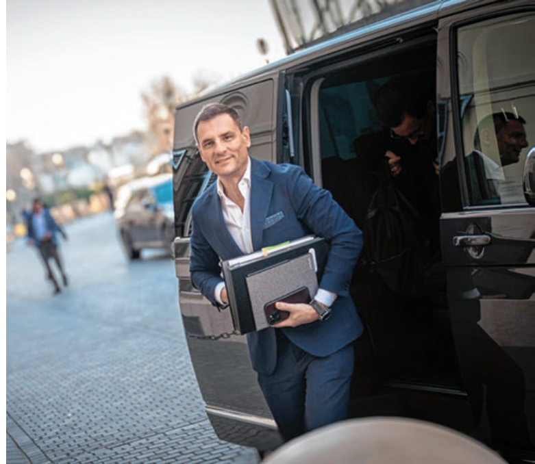
Tuzson Bence városunk és térségünk országgyűlési képviselője, hazánk igazságügyi minisztere

A nemrég kezdődött Nemzeti Konzultációról elmondta, hogy a kormány fontosnak tartja, hogy nemzeti egyetértés álljon a döntések mögött: „Ezért van kiemelt jelentősége annak, hogy mindenki elmondhassa a gondolatait. Közös jövőnk a tét, ezért minden vélemény egyaránt fontos. S éppen ezért arra kérek mindenkit Fóton is, hogy szánja rá azt a néhány percet, amennyit a konzultációs ív kitöltése igénybe vesz, és mondja el a véleményét.”