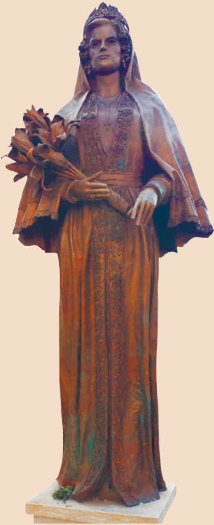
Az albán királyné szobra Tiranában

A fényűző esküvő után majdnem egy évvel, 1939. április 5-én megszületett a királyi pár egyetlen gyermeke, a trónörökös Leka herceg. Néhány nappal később a tündérmese valóságos rémálommá vált: 1939. április 8-án, Albánia olasz megszállása alá került, így a család hirtelen menekülni kényszerült. Először Görögországba mentek, a II. világháború idején Franciaországba, később Angliába. I. Zogu sikertelen próbálkozásokat tett egy emigráns kormány létrehozására, demokrácia kiépítésére. A II. világháború után kikiáltották az Albán Népköztársaságot, Enver Hoxha diktátor hatalomra kerülésével minden remény szertefoszlott, így sajnálatos módon a család