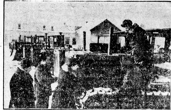
A rjazani Dokucsajevről elvezett védőerdősáv-állomás dolgozói befejezték a traktorok és mezőgazdasági gépek javításának munkálatait. Képeinken a kijavított traktorok átvételét látjuk.

A tavaszi munkák előkészítésénél is nagy felkészülésre nyúgnak a gép- és traktorállomások munkáján. Ezért igen nagy pozán átvizsgálják a kijavított műszerezési gépeket, melyek munkáján kerülni sor olyan javításra, amit még télen el lehetne végezni.