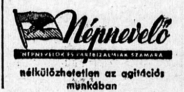
nélkülözhetetlen az agitációs munkában

Az üzbekisztáni andrijáni terület «Sztálinekolhozában hektáronként harminchékt mázsás gyapottermést értek el. E kolhoz jövedelme húszmillió rúbel volt.