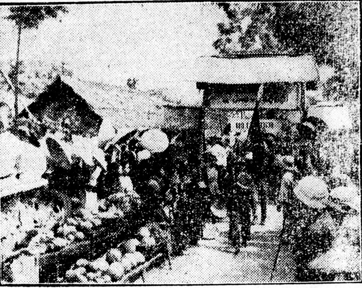
Képünk: a néphadsereg diadalmas bevonulását ábrázolja egy felszabadított helységre. A lakosság lelkes szeretettel és ajándékokkal várja a hős harcosokat.

A vietnámi néphadseregnek a Fekete- és Vörös-folyók vidékén elért győzelmei katasztrófális helyzetbe hozták a francia gyarmati ellenőrzés alatt álló területeket. A legutóbbi jelentések a Má-folyó környékének felszabadításáról és a francia területrelők fejezettel visszavonulásáról számoltak be. A vietnámi néphadsereg diadalainak egyik titka az, hogy a nép gyűlöli a francia megszállókat és bábjukat, Bao-Dajt és minden segítséget megad Ho-Si-Minh felszabadító hadseregének.