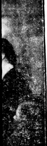
mben, a ter- rormmel veszi továbbm is pártjának.