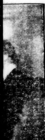
y ünnepnapra edi Ételi üzemi vet, így nyi- veszem az új hint a szemem dent, ragyogó