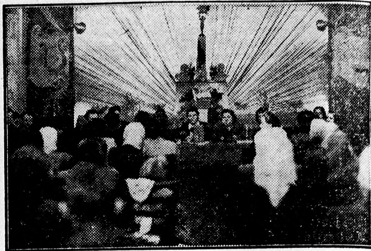
A gyönyörűen felszerített teremben mind együtt vannak a Gyulai Harisnyagyár kommunistái, hogy ünnepélyesen átvegyék a párttag-tartozást jelentő irasos dokumentumot: az új párttagsági könyvet.