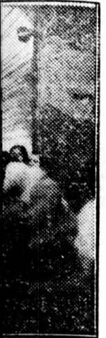
nak a Gyulai pártbóhoz tartozik.