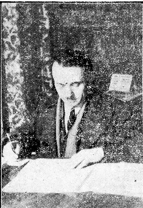
Letta tanulmányozom a marxizmus-leninizmus könyveit is, hiszen az hozzájárul a tisztánlátáshoz, az általános műveltséghez.»

A könyv, a tudás forrása mind több dolgozót hódít meg. Százak, sőt ezrek keresik fel hetenként a Megyei Népkönyvtár kolcsönzójét, olvasótermét. Szórakozást keresnek a nagyszorú magyar, szovjet és más szépirodalmi művekből és segítséget még eredményesebb munkájukhoz, a különböző szakkönyvekből. A megyei könyvtárban a tudományos, ismeretterjesztő művek mellett megtalálhatók a különböző folyóiratok, napilapok is, melyeknek naponta számos olvasója van.