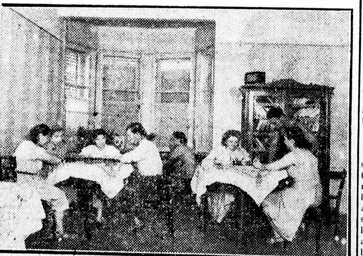
Az orosházi géppalomon is egyre több nő dolgozik. Munka után a géppalomon kulturális tanulóknak, szórakoznak.

3. «Vállaltuk, hogy öt év alatt 300 ezer új ipari munkásnak adunk kenyeret. Iparunk munkásszáma 300 ezerrel nőtt nem öt, hanem 3 év alatt. Vállaltuk, hogy megszüntetjük a munkanélküliséget. Megszüntettük: Magyarországon a munkanélküliség örökre a multé. Megvalósult a férfiak és nők egyenjogúsága, megvalósult az egyenlő munkáért, egyenlő bért elve. A nők százszázalékosra emelték a termelőmunkáiban, emeltük fel őket alárendelt helyzetükből.»