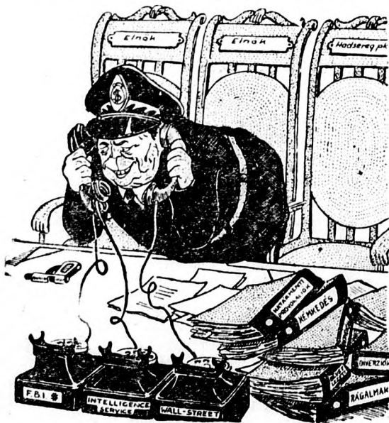
TITO: — Igen, megértem!

A nemrég elfogadott új fasiszta alkotmány értelmében a judás Tito halmozza a maga kezében a köztársasági elnöki, az ugynevezett szövetségi végrehajtó tanács elnöki, vezérkari főnöki funkciókat és ő képviseli az államot nemzeti és nemzetközi viszonylatban.