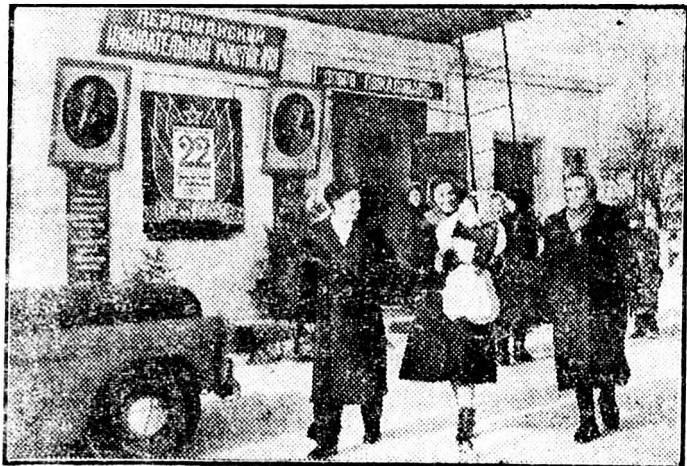
A képen: Szavazás után a Moszkva-területi Kalinyin-kerület pervomajszki 18. sz. szavazókerületében.

A Szovjetunió népeinek ünnepnapot jelentenek a választások. A választások alkalmával a szovjet emberek egy emberként tömörülnek a Szovjetunió Kommunista Pártja s a szeretett kormány mögé.