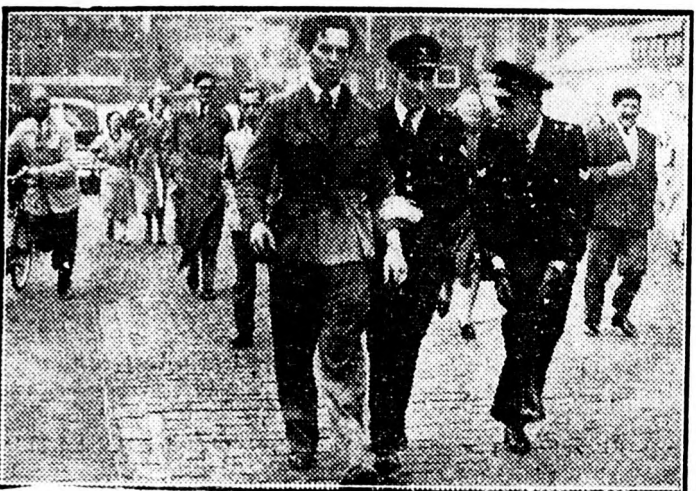
„Közvetlen útja a fasiszták útjával egy. Ezért üldözik környezetlenül a békeharcosokat. Hollandiában is hirtelen vár arra, aki békét akar. Képin-kon plakáttagasztó békeharcosát kísérnek be a rendőrök. De az egész világot nem lehet bebörtönözni. Békét akar minden becsületes ember s ez az óhaj tomorjti többszáműllős egységbe a népeket.