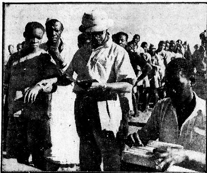
Ehért dolgoznak a délafrikai Williamson gyémánt bányákban a négerk. De nem sokáig tűnik ezt. Eledezik a négerk szabadságharcának tüze is, mely lángra kanya elsöpri az elnyomókat.