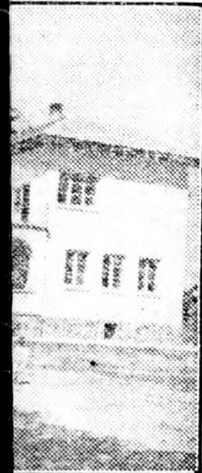
nek a bolgar gyer- munkájukat, mesterekhez tisztelet- ny mi lesz belőlük?