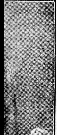
pusztít a szülők a szni a gyermeknek al. AROK NEPE gyei Pártbizottságának apja. szerkesztőbizottság, dó: Nagy Antal. és kiadóhivatal: Állam-ut 7, I. emelet, 22-85, kiadóhiv.: 21-76, nda, Békéscsaba. zető: Botyánszky PÁL.