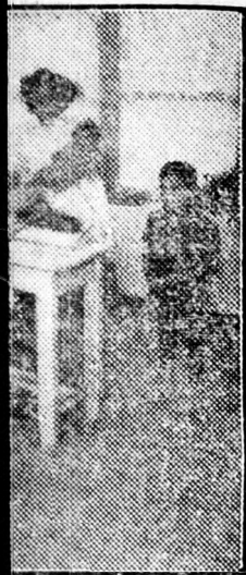
anyáknak nagyobb a gyermek, hogyan... ot, költséget fordítva... s-fővárosi Egészség- gyermeknek fejlődését.