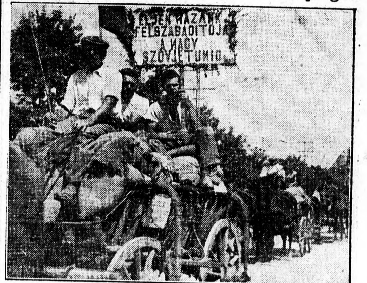
«Eljen hazánk felszabadítója, a nagy Szovjetunió!» — hirdeti a felirat a termelőszövetkezetek gabonát szállító kocsisorainak élén. Ez is ékes bizonyítéka annak, hogy dolgozó parasztjaink egyetlen tette közben sem feledkeznek meg nagy felszabadítójáról.