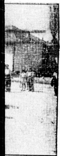
féle, hogy győztes színhelyre: