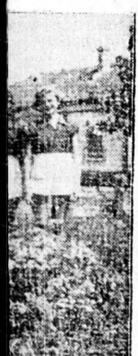
kos csendősorú dolgozók szalad VIT staféta ziszlaja vele Gyoma féle.