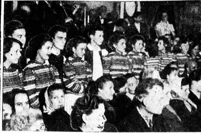
A Balassi-táncgyűttes tagjai — színes népviseletben — nézik az első bálzóknak táncbemutatóját.