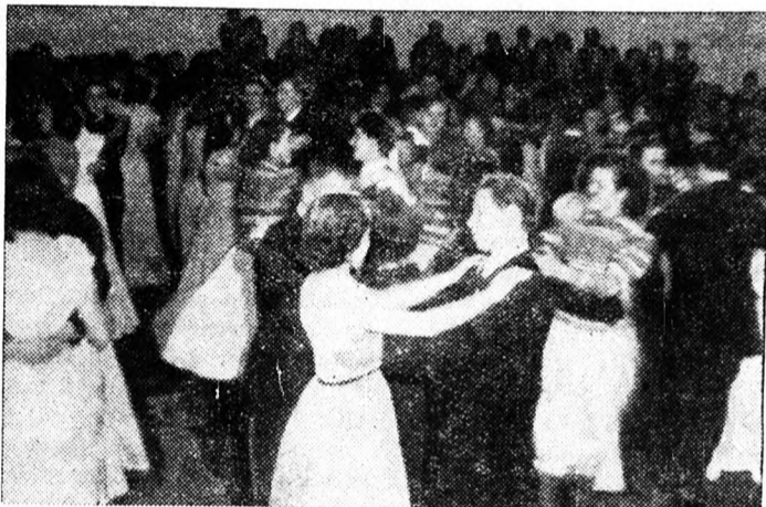
Csárdással megkezdődött a tánc.