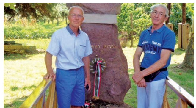
A szobrász és a hidépítő