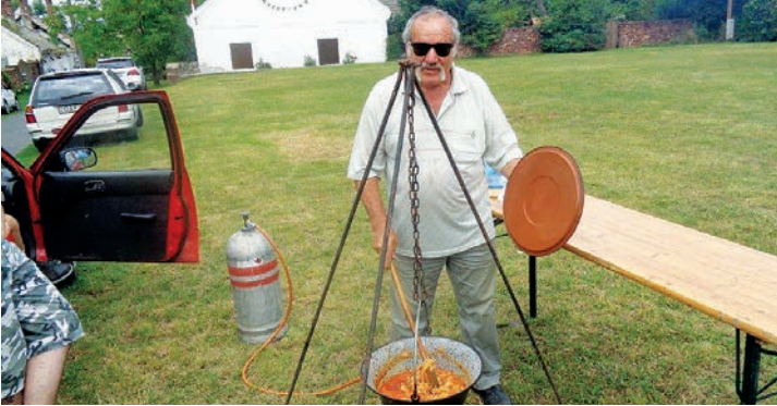
Győztes főzők 1.