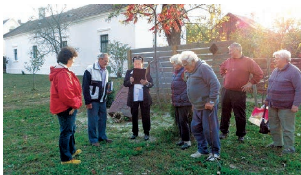
A versmondó és a közönség