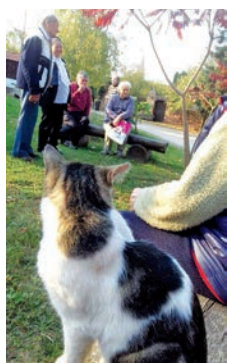
Cica az ünneplők között