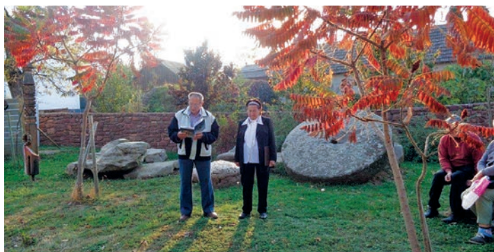
Ünnepi beszéd október 23-án