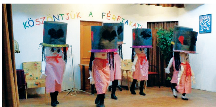
A törpék tánca