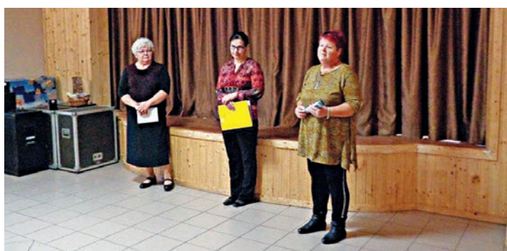
Köszöntjük a férfiakat.