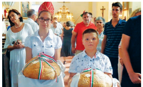
A megszentelt kenyér