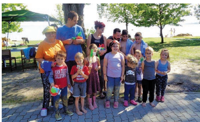
Díjazottak Pálkövén 2.