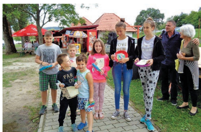
Díjazottak Pálkövén 1.