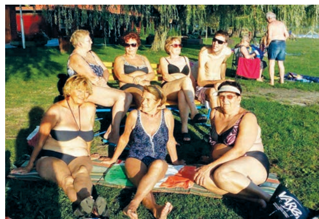
Hölgyek a pálkövei strandon