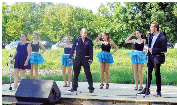
A Tapolcai Musical fiataljai