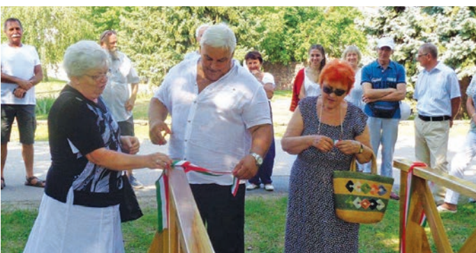
Hidavatás augusztus 20-án