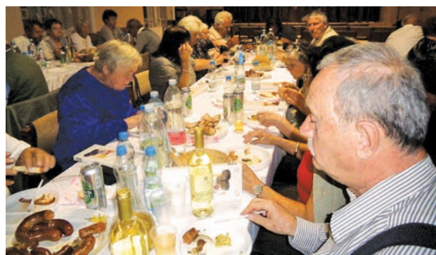
Idősek napi uzsonna