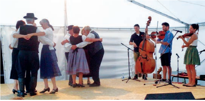
Nemzedékek a színpadon