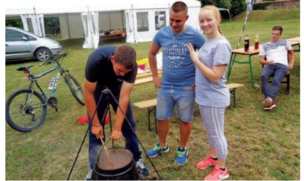
Győztes főzők 2.