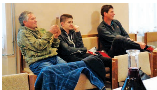
Fiúk és férfiak.