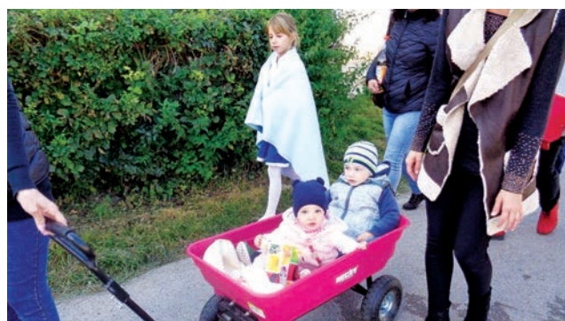
Utánpótlás a szüreten