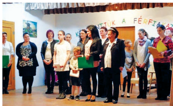
Virágok a fiúknak