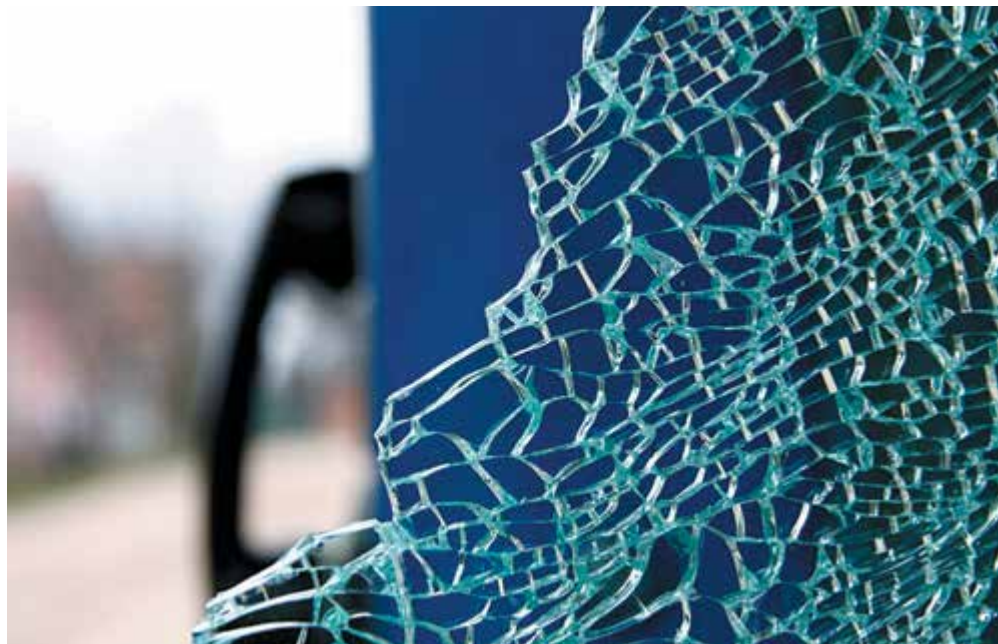
Csörgés és csörömpölés

A Magyar kultúra napjához kötődő eseménysorozat keretében január 17-én kiállításon mutatkozott be a József Attila Művelődési Házban a Szenzor Fotókör. A tizenkét gödi fotóművészből álló alkotócsoport eddig sem volt ismeretlen a város lakói számára: a felsőgödi Kínai Áruháznak az Ady