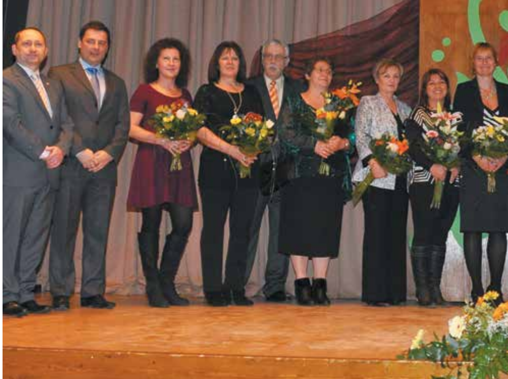
A kulturális élet különböző területein tevékenykedő díjazottak örömeiben osztottak a város vezetői és a díszvendégek is

Az ünnep eredetéről, a himnusz „születéséről” is beszélt a város első embere, illetve arról, hogy 1990-ben beemelték a nemzeti jelképek közé. Véleménye szerint a himnusz az a vers, illetve ének, amely korszaktól és korosztálytól függetlenül az együvé tartozás érzését, a haza, a nemzet, a szabadság érzésének átélését biztosítja minden alkalommal azoknak, akiknek az ajkán felcsendül.