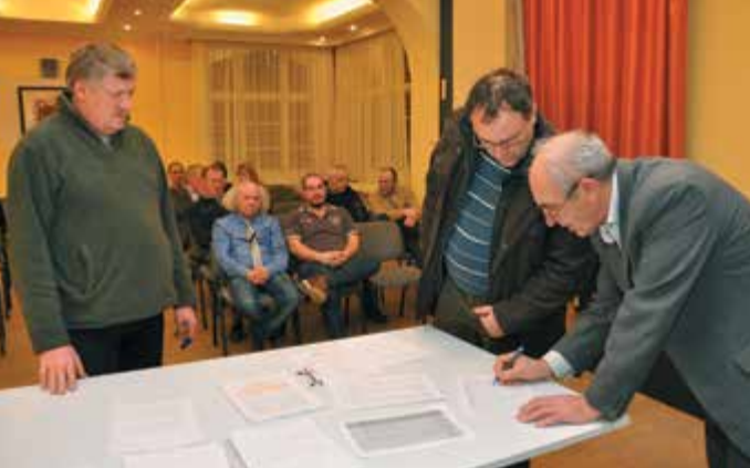
A kamarai bizottság alakuló ülésén minden gazda regisztrált