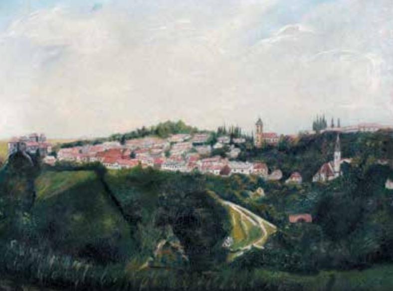
Csontváry egyik újonnan előkerült képe, a Városka a domboldalon