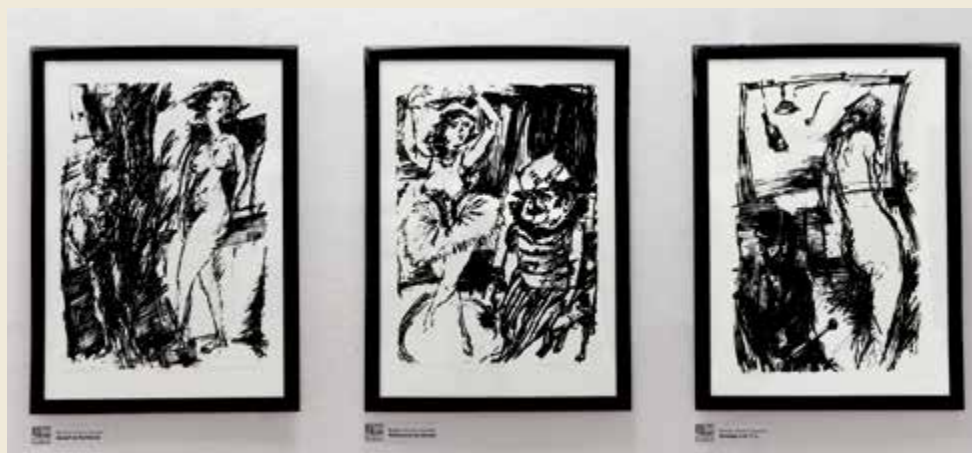
József és Putifárné (szitanyomat 70x50cm)