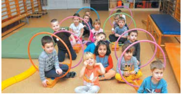
Az egész életen át tartó egészség és jóllét megőrzéséhez elengedhetetlen az egészséges életmód. Ennek alapjait is kisgyermekkorban kell elsajátítani