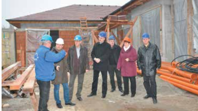
Januárban a város vezetői és Tuzson Bence területi fejlesztési biztos (balról a második) szemlét tartottak az új óvodaegység építkezésén

A szervezők a műsorváltoztatás jogát fenntartják. Az ünnepi műsorok kezdési időpontjai tájékoztató jellegűek, a koszorúkat elhelyezők számától függően az egyes helyszíneken néhány időpontváltozás lehetséges.