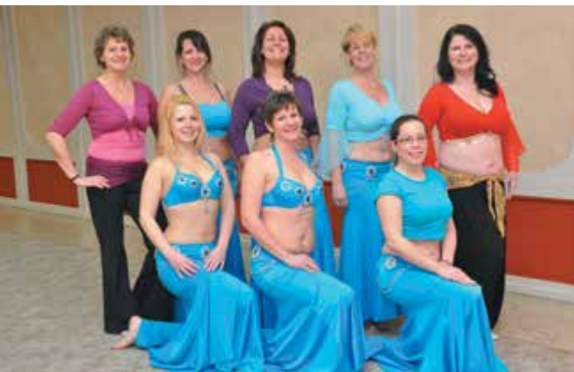
A József Attila Művelődési Ház nagyterme ideális helyszín a hastáncosoknak a gyakorlásra