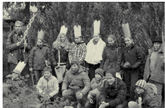
A kép az első csillagjáráson készült, 2013-ban

Az egykori felelgetős játékok napjainkra inkább köszöntő formában maradtak fenn.