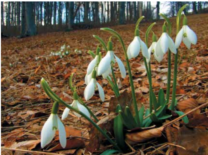
Az enyhe, csapadékmentes tél után a szokásosnál korábban ébred a természet. Egy-egy – akár csak rövid ideig tartó – hideg időszak azonban súlyos fagykárokat okozhat

A jelek szerint idén szokatlanul enyhe a tél. Február elejére egy kicsit talán az évszakhoz illőbb, zimankósabb napok jöttek, de ez már nemigen változtathat azon a tényen, hogy a kifejezetten meleg (és száraz) december és január miatt a természetnek – és a kertjeinknek – ritka kihívásokkal kell/kellett szembenéznie.