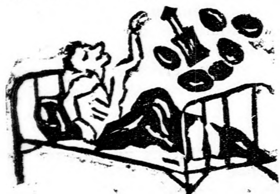
3. Gyötrő álm (Sólyom Bálint rajzai.)