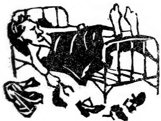
2. Munka után jól esik a pihenés.