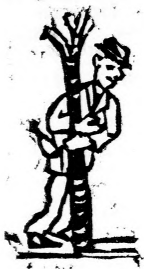
1. Egész uton hazafelé...