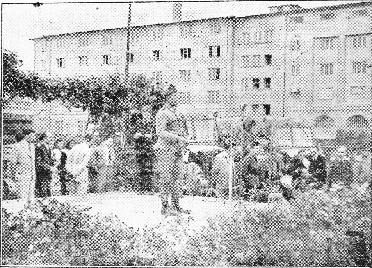
Az elvonuló alakulatok parancsnoka köszönetet mond a Kőbányai Polgári Serfőző és Szent István Tápszerművek Rt. munkásainak

Ezután az elvonuló alakulat parancsnoka válaszolt az elhangzott beszédekre, köszönnvén a gyár vezetőinek és munkásainak szeretetét. A beszédek után átadták a gyár által ajándékozott négy nemzetiszínű lobogót, majd kiosztották a munkások ajándékosomagjait. Ezután műsor következett, majd a gyár étellel-itallal bőven megvendégelte a honvédeket.