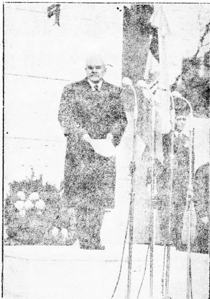
Kassa visszatérésének 5-ik évfordulóján Kállay Miklós miniszterelnök ünnepi beszédet mondja

— Járó-kező békéscsabai polgár! Adakoztál-e már az Országzászlóra!?