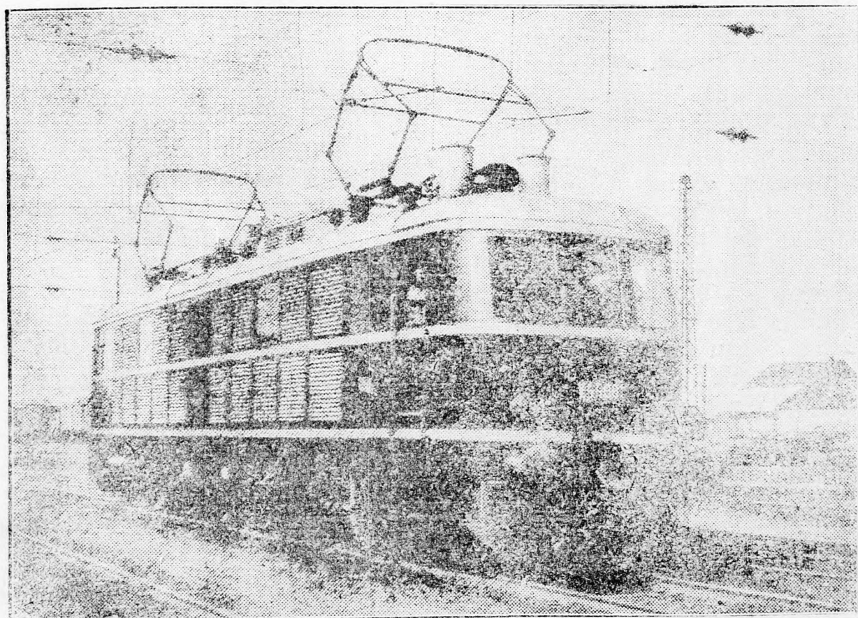
A magyar ipar a háborús nehézségek ellenére is tovább fejlődik. A Budapest—Hegyeshalom közötti vasútvonalon megindultak a legújabb gyártmányú villamos-mozdonyok.

Aki félrebeszél, aki most akadályt gördít a nemzet erőinek összpontosítása, felfokozása elé, az — lehet akárki, viselhet akármilyen rángot, vagy címet, — áruló s méltó az árulónak kijáró sorsra.