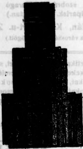
Nagykikindai gyártmány. Bohn-féle szab. biztonsági átfedőcserep 272. szám.

Képes árjegyzék és minták kívánatra ingyen és bérmentve.