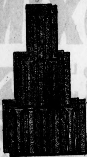
Nagykikindai gyártmány. Bohn-féle szab. biztonsági átfedőcserep 272. szám.