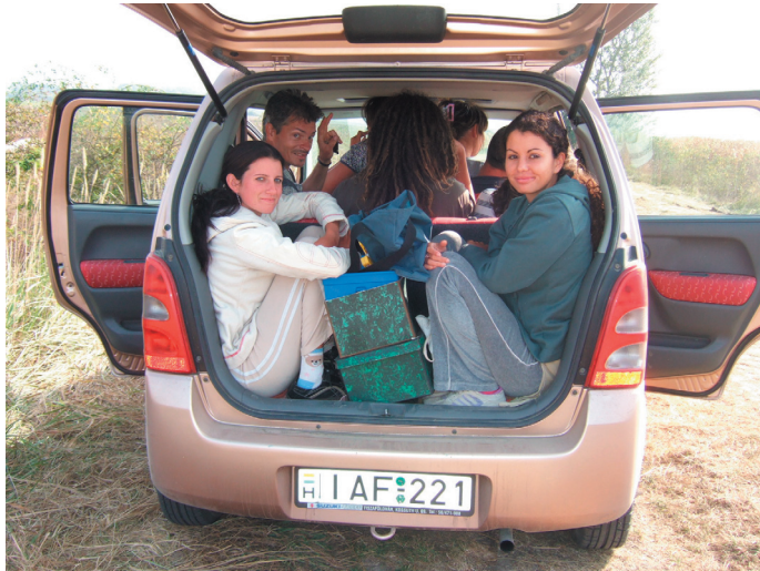
Megérkezés a lelőhelyre

Mindig érdekesen játszik velünk az élet, egy ismeretlen (és mégis ismerős) valami úgy forgatja a sors kerekét, hogy az ember nem is sejtí hová sodródik az úton. Mert sodródik bizony, és persze soha nem véletlenül. A Jászdózsai régészcsapat is így érkezett meg egy vasárnap a falu főterére, hogy elfoglalja szállását a Diákotthonban.