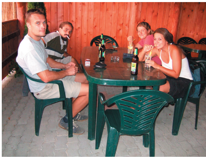
A nap végén a Happy Endre-ben

Minden 2006. október 15-én végződött. Igen, befejeződött, de az emlékek velünk élnek tovább. Hála azoknak, akik be-