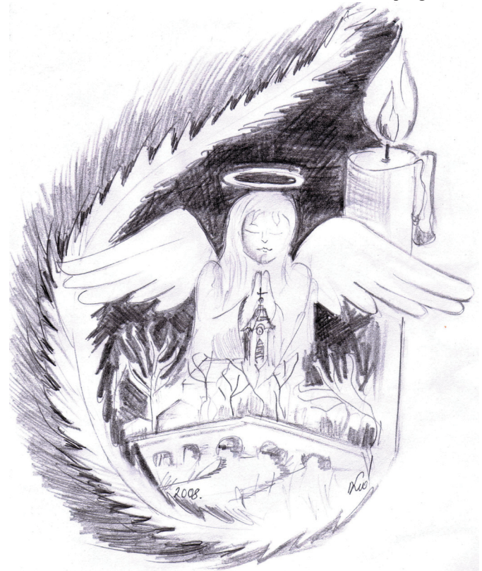
Lukácsiné Forgács Irén rajza