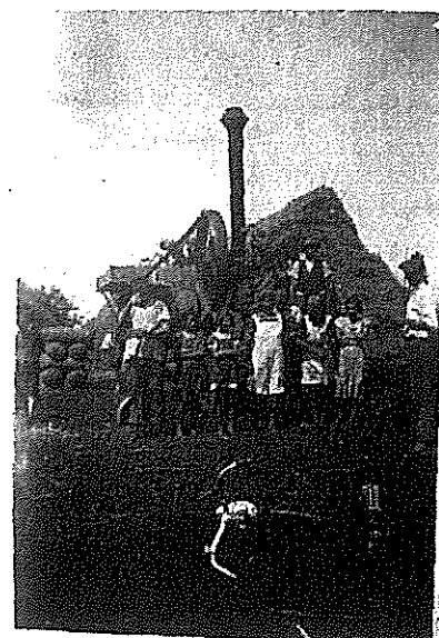
8. kép: Keresztanyám a cséplőgépnél

gyereksapat kísérté a cséplőgépet egyik tanyáról a másikra. Mikor hozzánk értek az volt az öröm. Jött a cséplőgép, utána férfiak, nők, porosan – piszkosan, de jó kedvvel. Hozták a szerszámaikat, villát, gereblyét