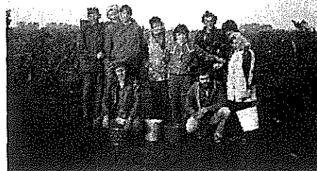
9. kép: Szüretelünk

az vitte a gyűjtő kádba, darálták, sutulták és jött a finom édes must.