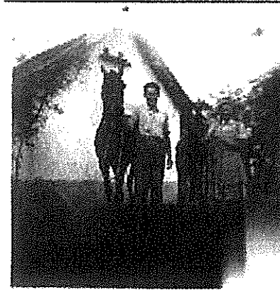
3. kép: Sógorom és a sógornóm a lovaikkal

Tavasszal, még nem zöldült ki minden, de már elkezdődött a szántás, vetés, ami igazából a férfiak dolga volt. Ki egy lóval, ki kettővel, ökrökkel is szántott, volt olyan is, aki a kis tehenével.