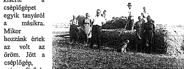
7. kép: Behordás

mentek a másik tanyára, ahol már várták őket. A gyereksereg