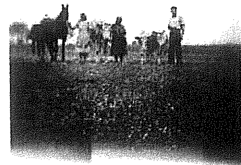
2. kép: Tanyasi pillanatkép

Utána az istállón keresztül jutottunk a szobába, a konyhába és végül a kamrába. Nagyon tiszták és rendezettek voltak ezek a helyiségek. Azért volt így, mert a téli időkben sokkal kevesebb tüzelés kellett. Hűtőszekrényünk nyáron a pince volt - már akinek volt -, és a kút. A hűteni kívánt dolgokat fazékba raktuk, lefedtük valamivel, és kötélen leengedtük annyira, hogy a vízbe ne érjen. Nem sokáig lehetett így tárolni, esetleg 1-2 napig.