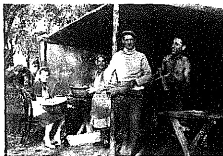
10. kép: Készülődés a lakodalomra

sütés-főzés, vendégvárás. Akkoriba a vendégeket tejeskávéval és rostélyos kaláccsal kínálták.