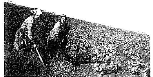
4. kép: Kapáló asszonyok

dolga volt a kotlós ültetés. Egyszerre, 5-6 kotlós is ült, és bizony