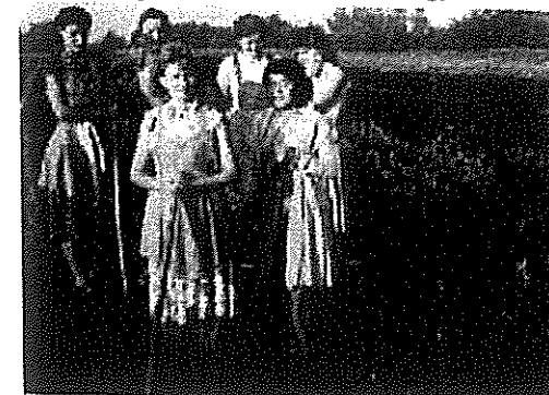
5. kép: A kapáló lányok

végzett. Később, ahogy növekedtünk, ez már a mi dolgunk, a gyerekeké lett. Bizony sokszor eljártunk, ezt az állatok mindig észrevették, bele mentek a tilosba, lelegelték a vetést, a kukoricást, átmentek a szomszéd legelőjére, ez bizony baj volt. Amikor kikeltek az elvetett vetemények, lehetett kapálni. Erre mindig összeállt egy - két család, előbb az egyik, aztán a másik családot kapáltak, így segítettek egymáson. Közben kikeltek a kis csibék, libák, kacsák, pulykák, aminek gondozása igen sok munkával járt. Kizöldült a határ, így telt el a tavasz. Rengeteg