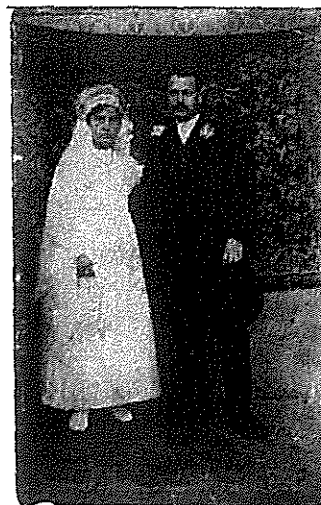
11. kép: Keresztanyám esküvője

Aztán a lagzik ideje is eljött. Több napos készülőds után,