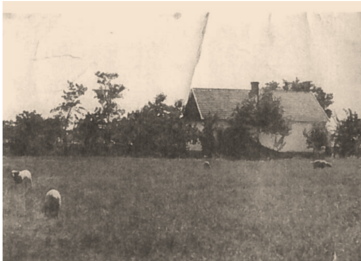
Anyai ági rokonságom tanyája a jászdózsai határban.

„Eltűnt tanyavilág Jászdózsán” (oktatás, kulturális élet, ünnepek, hétköznapok, népszokások a tanyán)