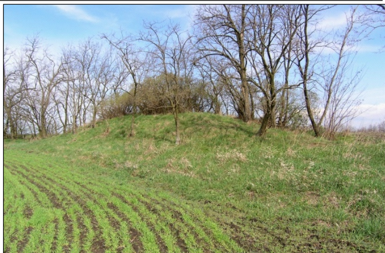
15. A Szerelem-halom Jászdózsa–Jászfákóhalma határán

A következő meglévő határdomb a második katonai felmérésen Szerelem-határnak nevezett, a birtokvázlaton 22-es számot kapott és „Szerelem halom”-ként megnevezett határpont, amely kb. négyméteres magasságával kiemelkedik a határdombok közül (15. kép).