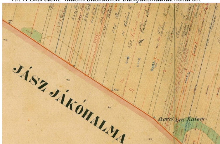
16. A „Szerelem halom”-ként megnevezett 22-es számú határdomb a birtokvázlaton

Érdekessége, hogy a domb középvonalában a tetejére is felvezető árok található, az adott határszakaszon húzódó keskeny árok folytasaként. Az 1884. évi birtokvázlaton ez az egyetlen határdomb, amely feliratként nevet is kapott (16. kép). A Szerelem-halom megnevezés azonban mára feledésbe merült Jászdózsán. A Jászdózsa–Jászberény határvonalon a Dózsa–Berény–Árokszállás sarokhatáron csak a ma is meglévő, a birtokvázlaton (17. kép) a települések kezdőbetűivel jelölt, hármass földhányást (18. kép) követő három határdomb maradt meg.