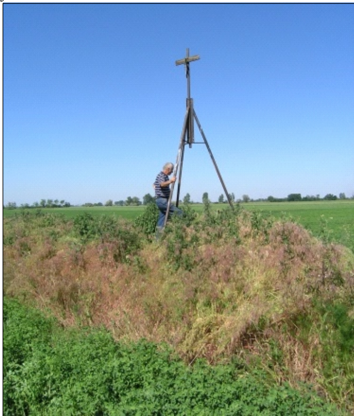
13. Gúla határdombon a Jászdózsa–Jászapáti határon

A vasútvonaltól délre lévő határdombon régi földmérő gúla áll (13. kép). Felállításának időpontja nem ismert, a térképek nem jelölik.