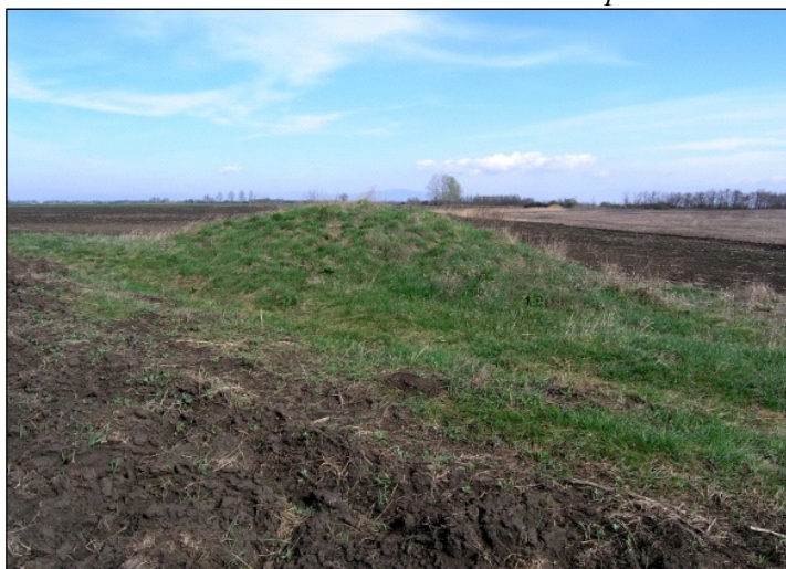
14. Jászdózsa–Jászfákóhalma, - határdomb a Holt-Tarna mellett

Délen, Jászdózsa–Jászfákóhalma határán a ténylegesen is háromdombos Apáti sarkon kívül még három határdomb van. Közülük az egyik a 19. században, így a birtokvázlaton is, még a Dózsa–Berény–Jákóhalma sarokpontot jelölte. A 20. századi topográfiai térképek szerint azonban ez a sarokpont mára kissé nyugatra eltolódott. A határdomb sérült, valószínűleg amiatt, hogy a mellette menő földút nem volt elég széles a nagy munkagépek elhaladásához. A Holt-Tarna mellett található Jászdózsa egyik legszebb határdombja, szabályos kör alaprajzzal, ép felszínnel és ősgyep borítással (14. kép).