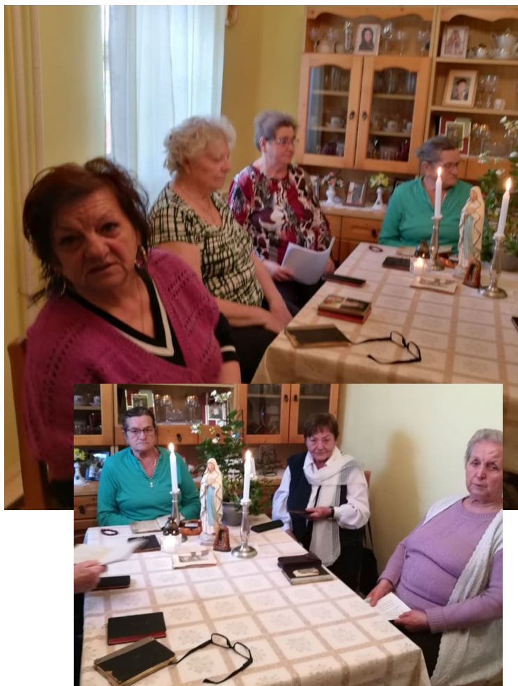
A Szent Sír a jászdózsai templomban

A lourdes-i barlang, benne a boldogasszony szobra