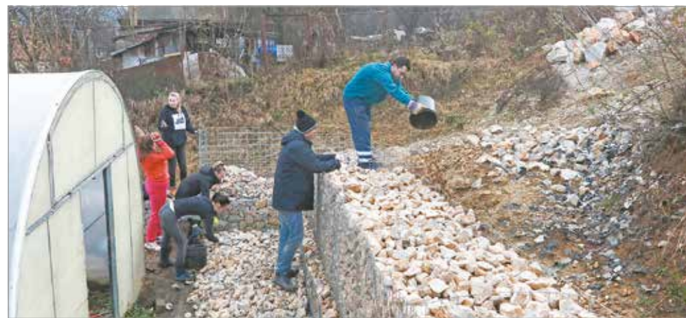
Pénteken az MSZC tanulóit mozgósították.