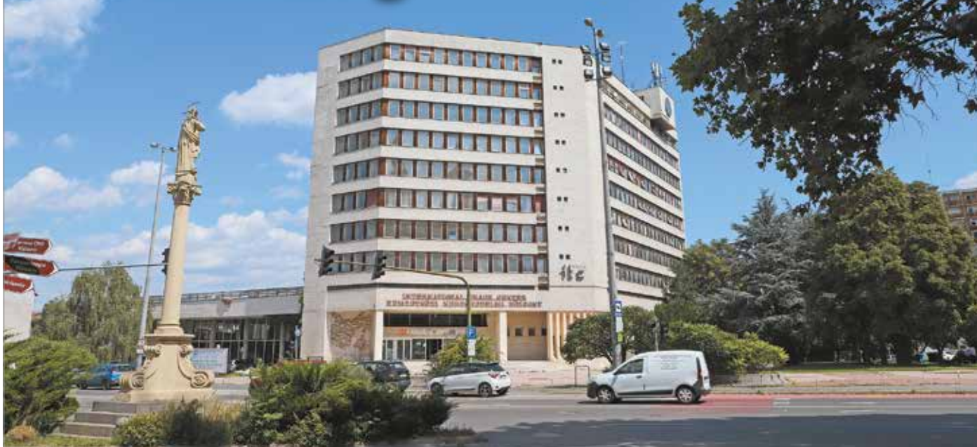
A mérnökök álláspontja szerint az ITC szerkezetével semmi olyan probléma nem lehet, ami a bontást indokolná.

Volt, aki szerint Dósa Károly 1977-es épülete jelentős építészeti értékkel bír. Kiemelték, funkcionális épületről van szó, ami szerkezetileg kiváló, könnyen átépíthető. Egy felszólaló megjegyezte, a belső tér az alsó előadóteremmel, illetve a galériával a mai napig esztétikai értéket képvisel. Akadt, aki határozottan úgy vélte, egy olyan nagyvárosias léptékű épületnek, mint az ITC, van helye Miskolc központjában. Hozzátette, a székházhoz hasonló, 500 fő befogadására alkalmas rendezvényközpontja nincsen jelenleg Miskolcban. A mérnökök véleménye szerint nincs akadálya a funkcióváltásnak, mert az irodából lakóépületté, vagy rendezvényközponttá tör-