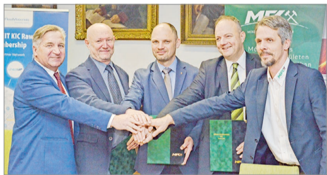
Szorosabban működnek együtt a tanulóikért.

– Mindannyian elköteleztük magunkat abban, hogy a fiatalok itt találják meg a boldogulásukat – hangsúlyozta. BACSÓ ISTVÁN