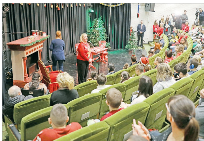
Több mint hatszáz gyermeket lepte meg.