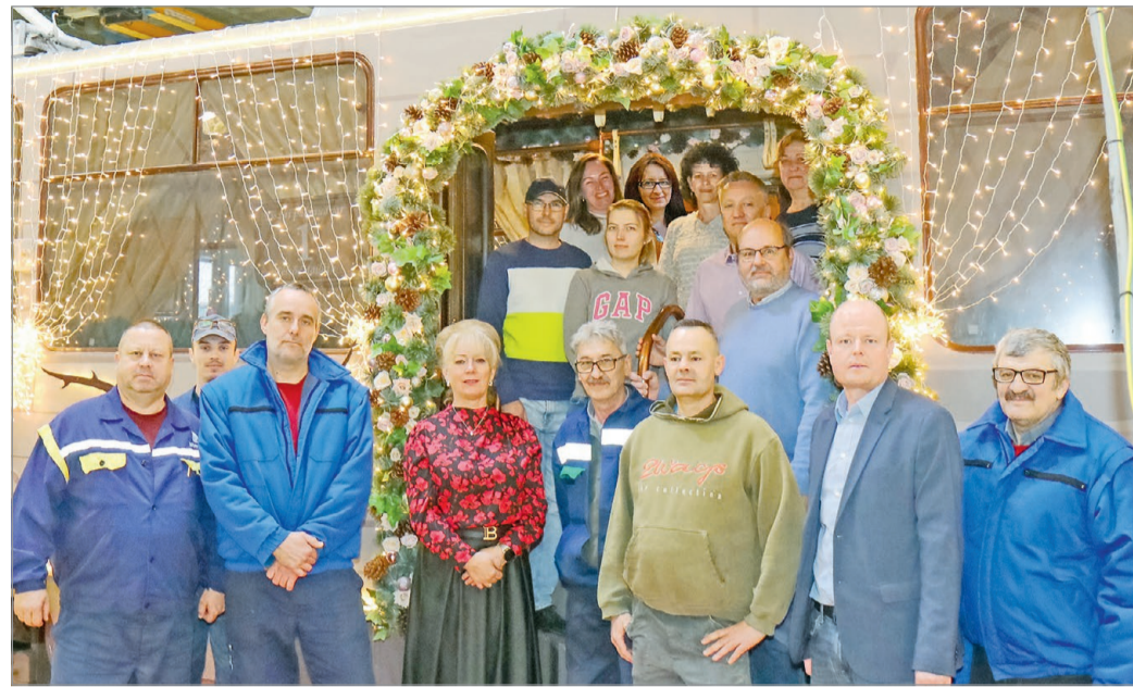
Ők álmodták meg a miskolci adventi villamost.

Hozzáadték, bár minden évben úgy érzik: az aktuális díszítés a kedvencük, idén különösen büszkéek a rózsakapukra és a 3D-s hatású külső dekorra.