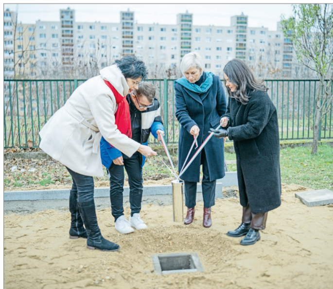
A fogyatékkal élő gyerekeknek is jár egy pálya.