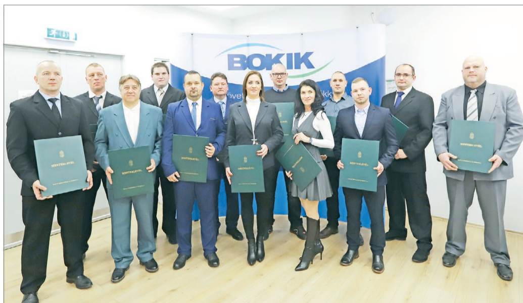
Tizenhárman vehették át mesterlevelüket a BOKIK-tól.

Kifejtette, hogy a mesteravató nagy múltra tekint vissza, hiszen az iparkamara is 1880 óta