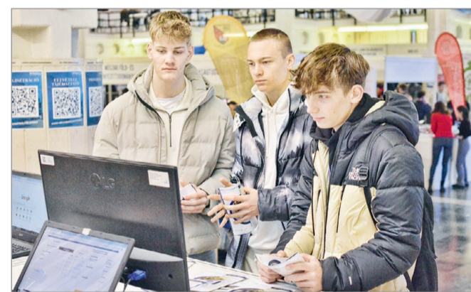
Nyolc kar közel háromszáz képzést kínál a Miskolci Egyetem.

– Nyolc kar kínál nálunk közel háromszáz képzést. A felsőoktatási szakképzéstől