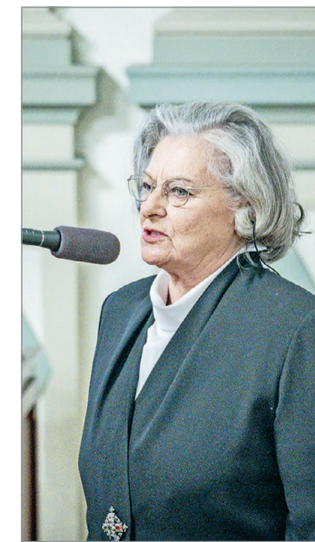
Várhelyi Krisztina szervező.