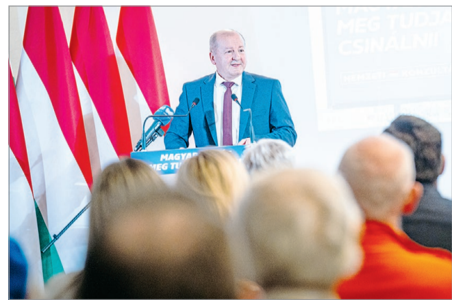
Simicskó István: komoly kérdések vannak napirenden.