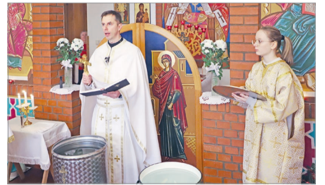
Vízszentelés az avasi jezsuita templomban.