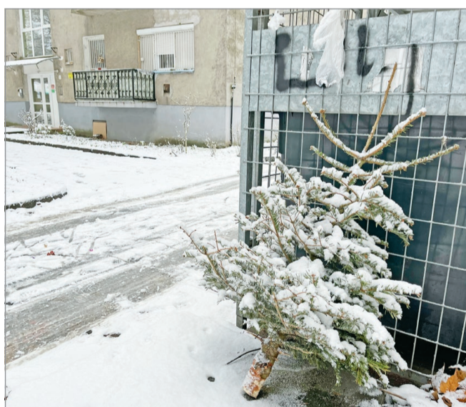
Január közepén indul a gyűjtés. Fotó: Cziffra Andrea

Az ezt követő héten folytatják a munkát: január 20-