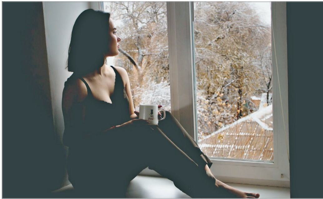
Év elején is van ellenszer az örömtelenség ellen.