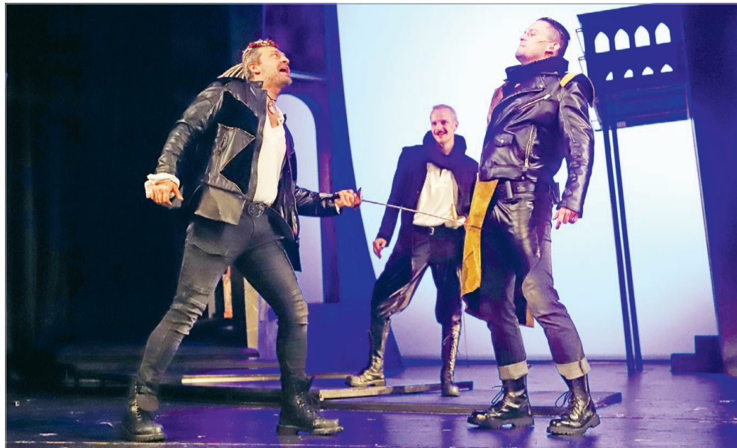
A Rómeó és Júlia is nagy sikerrel fut a Miskolci Nemzeti Színházban.

2024. második felében a helyi teátrum olyan volt, mint egy chicagói old school rapper: bemutatott, bemutatott és bemutatott. Középső ujjak helyett azonban operát, rémbohózatot, vígjátékot, mesejátékot, táncjátékot, szobadrámát és fazonírozott Shakespere-t is láthattak a miskolci nézők. Minden darabot nem fogunk külön említeni, azonban érdekes megnézni, hogyan építi fel a művészeti tanács az évadot. Természetesen a nagyszínpadi, előre láthatóan közönségsiker előadást jó érzéssel az ünnepek elé tették. Az elképzelés működött: a Keszég László rendezésében bemuta-