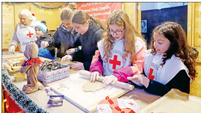
Szorgos kezek a Sütigyrában.