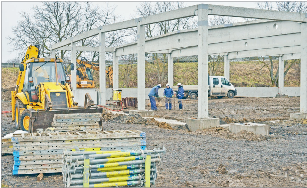
Már építik a komplexum szerkezetét.

A beruházó FK-Raszter Zrt. vezérigazgatója szerint – hozzájuk tartozik az egyik telek, amelyen a központ felépül – a beruházással valóban céljuk volt az elhanyagolt terület hasznosítá-