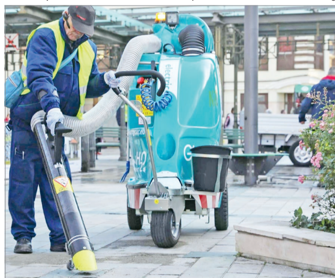
„Ráfért a városra a nagytakarítás”

– A város bevételeit és kiadásait meghatározzák a jogszabályok és meghatározza az állami költségvetés, amit meghatároz az ország teljesítőképessége, a kormány szándékai és lehető-