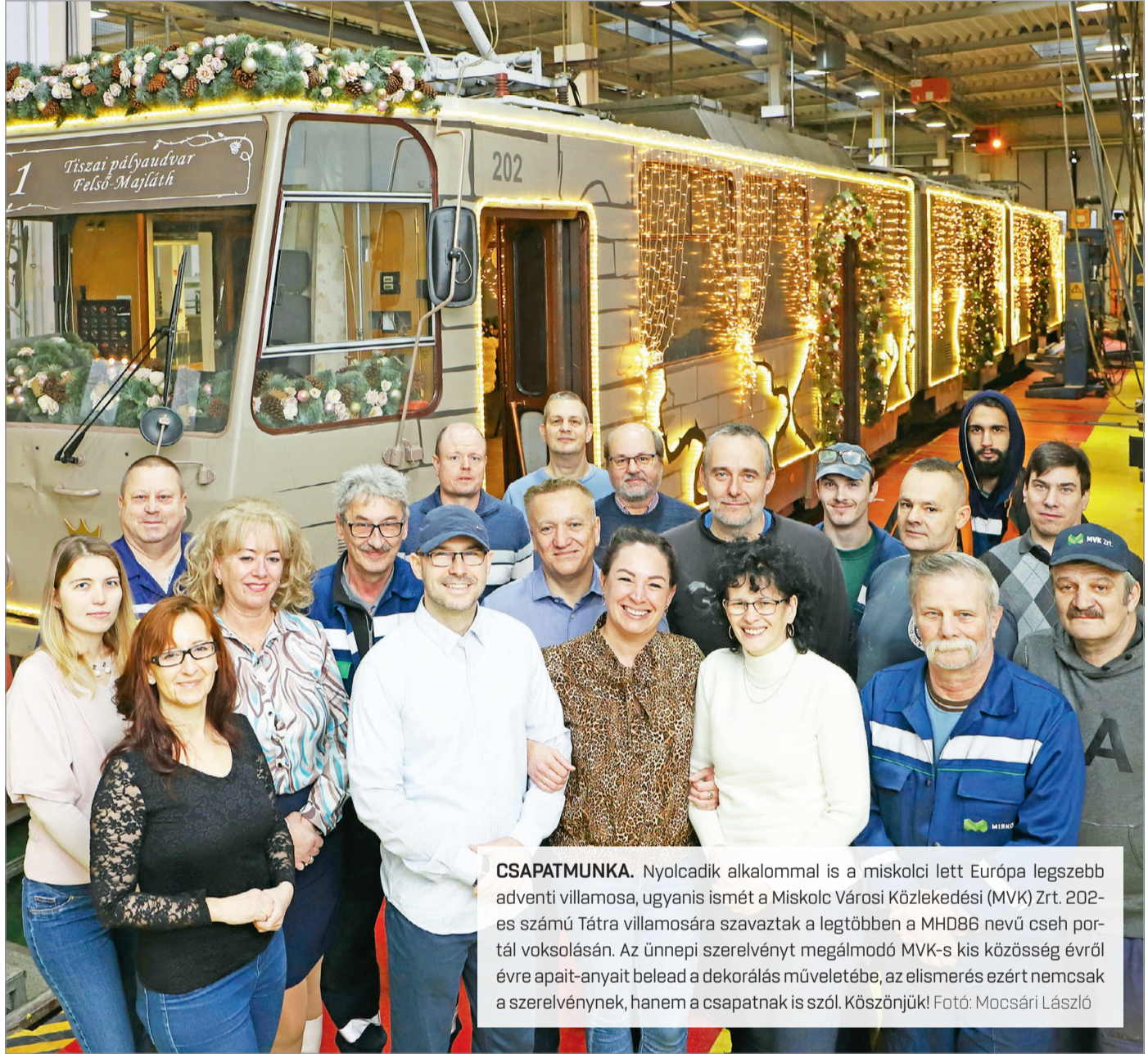
CSAPATMUNKA. Nyolcadik alkalommal is a miskolci lett Európa legszebb adventi villamosa, ugyanis ismét a Miskolc Városi Közlekedési (MVK) Zrt. 202-es számú Tátra villamosára szavaztak a legtöbben a MHD86 nevű cseh portál voksolásán. Az ünnepi szerelvényt megálmodó MVK-s kis közösség évről évre apait-anyait belead a dekorálás műveletébe, az elismerés ezért nemcsak a szerelvénynek, hanem a csapatnak is szól. Köszönjük!