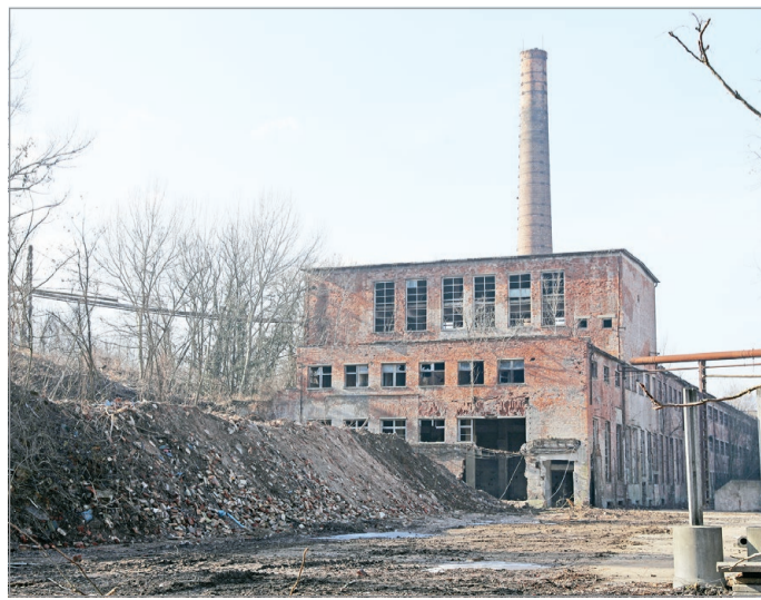
Együttműködésben újítják meg.