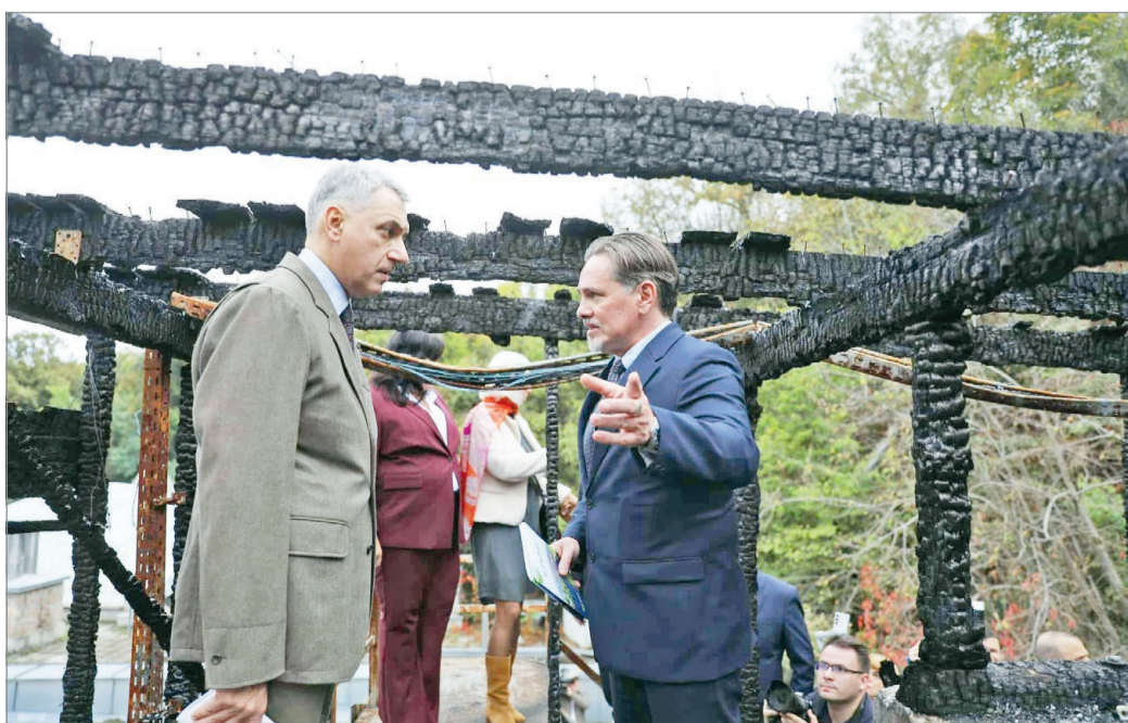
A Barlangfürdő újjáépítéséről Lázár Jánossal is tárgyalt Miskolc polgármestere

– Nem. A hitelek egyik része a beruházások befejezéséhez szükséges, másik része a korábban önerőből megelőlegezett kiadások visszafizetésére, melynek célja a negatív működési egyenleg részbeni kezelése volt mintegy 1,2 milliárd