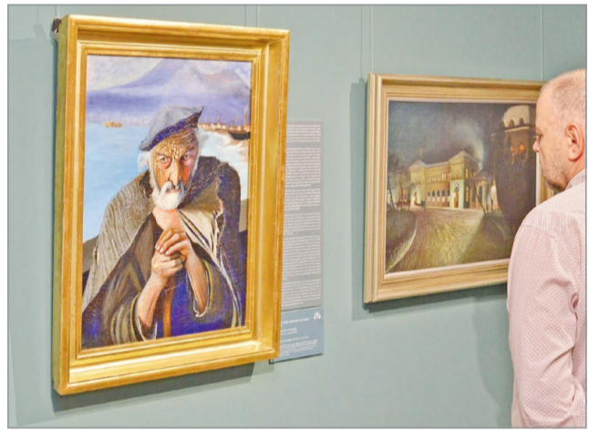
Több ezer látogatót köszönhetett a múzeum.