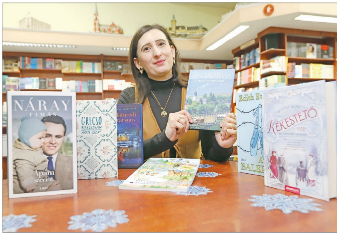
Helyi szerzők is a legnépszerűbbek között.

– A könyvtárunkban külön teremben helyezkedik el egy nemzetiségi gyűjtemény, ahol a Miskolcon önkormányzattal rendelkező nemzetiségek dokumentumait, szép- és szakirodalmait gyűjtjük – sorolta, kiemelve: a könyvtár munkatársai nagy figyelmet fordítanak arra, hogy az intézmény ne csupán a nemzetiségek közösségi helye legyen, hanem egy nyitott tér, ahol minden érdeklődő az anyanyelvétől függetlenül otthon érezheti magát. MN