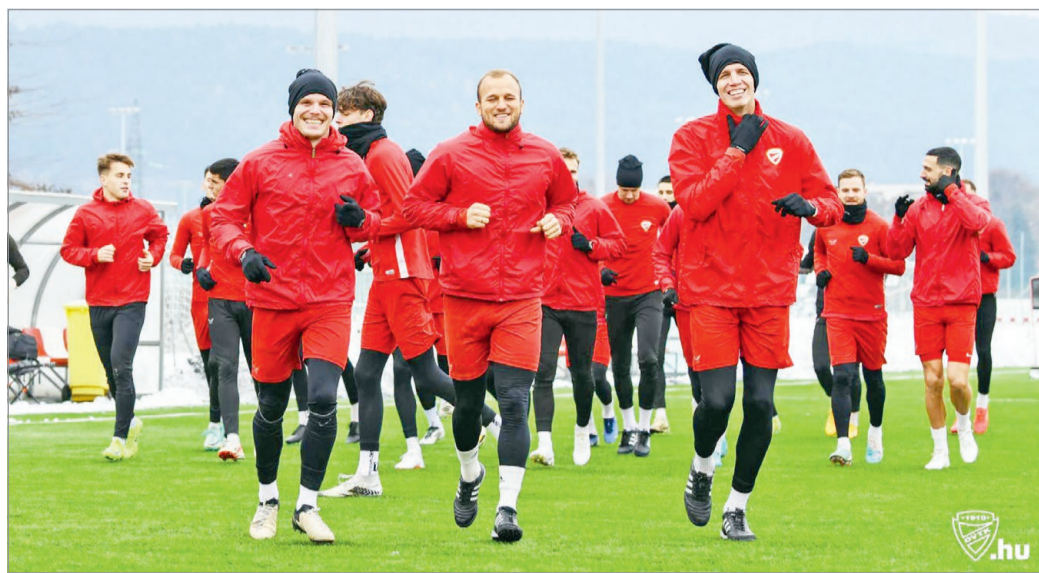
Indokolt a jó hangulat: a dobogóról folytatja a szezont a DVTK.