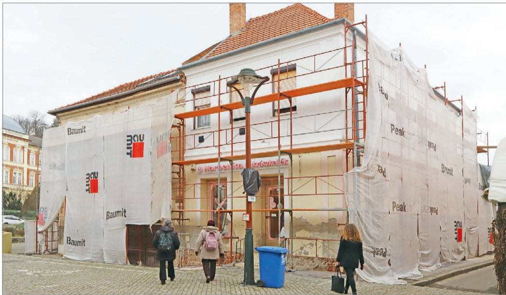
Teljesen felújítják az épület homlokzatait.

A Grabovszki-ház ugyan egyetlen házsza alatt áll, tulajdonképpen három külön épült házból áll, melyek az évtizedek,