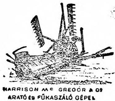
HARRISON MC GREGOR & CO ARATÓ ÉS FÜKASZÁLÓ GÉPEK