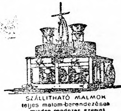
SZÁLLÍTHATÓ MALMOK teljes malom-bereendezés minden rendszer szemnt