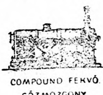
COMPOUND FEKVŐ GŐZMOZGÓNY