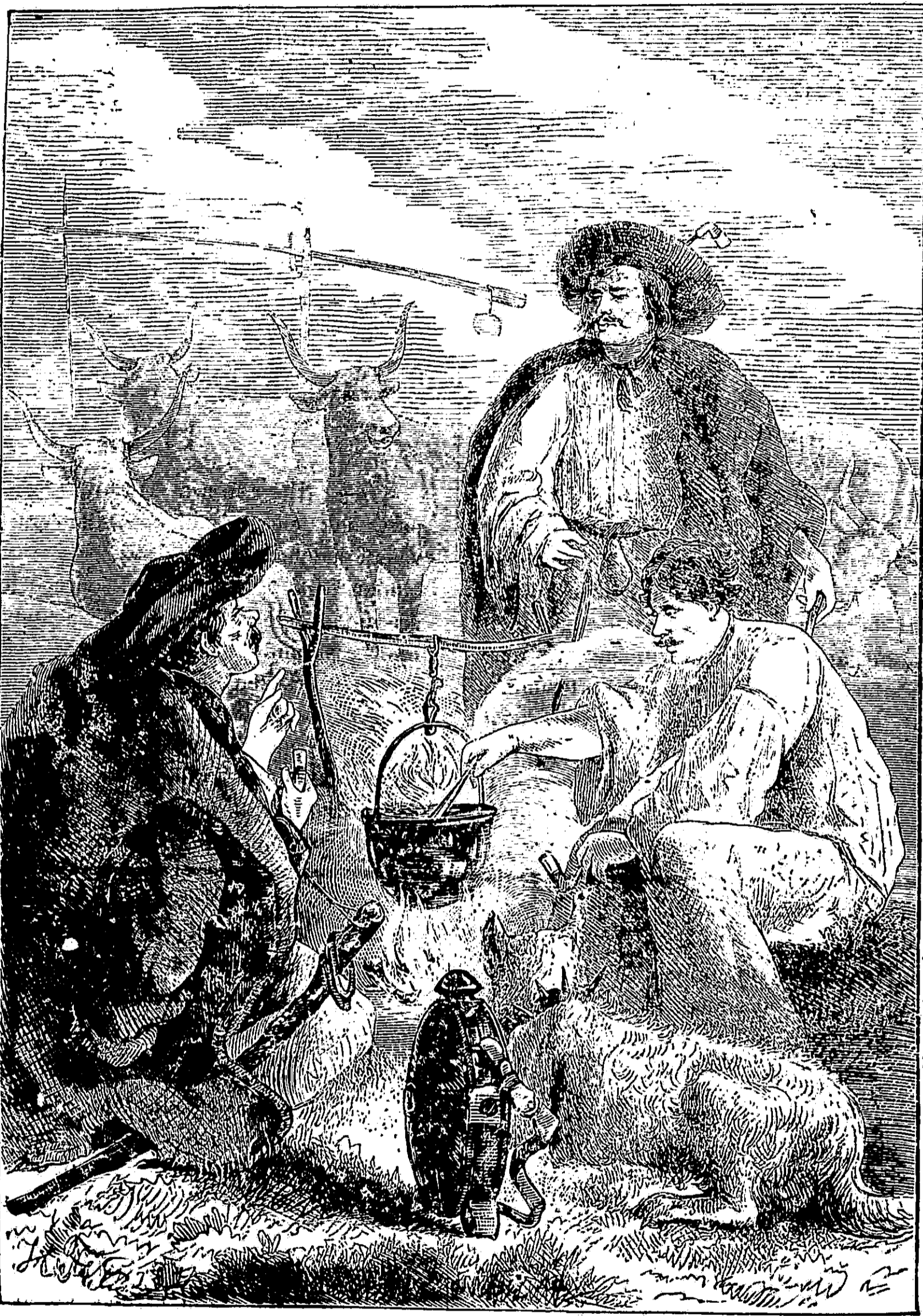
Képek a magyar népeletből. I. — A gulyás.