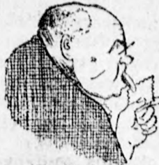
PRIBICSEVIC : AZ ANYA- NYELVÉT MINDENKI SZABADON HASZNÁLHATJA