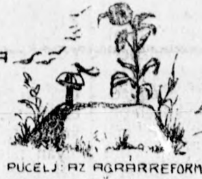
PUCELJ : AZ AGRÁRREFORM BIZONYOS IDŐ MULVA A KISEBBSÉGEKET IS FOLDHOZ FOGJA JUTTATNI...