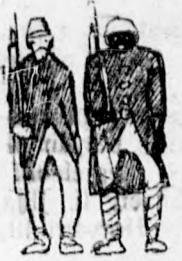
AZ ÚJ KÜLFÖLDI KÖLCSON UTBAN AUSZTRIA FELE