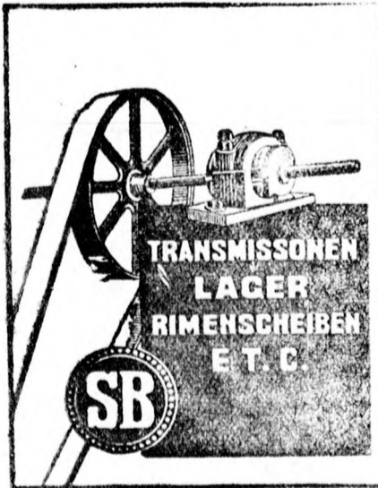
TENGELYEK, CSAPÁGYAK, SZIJTÁRCSÁK stb.