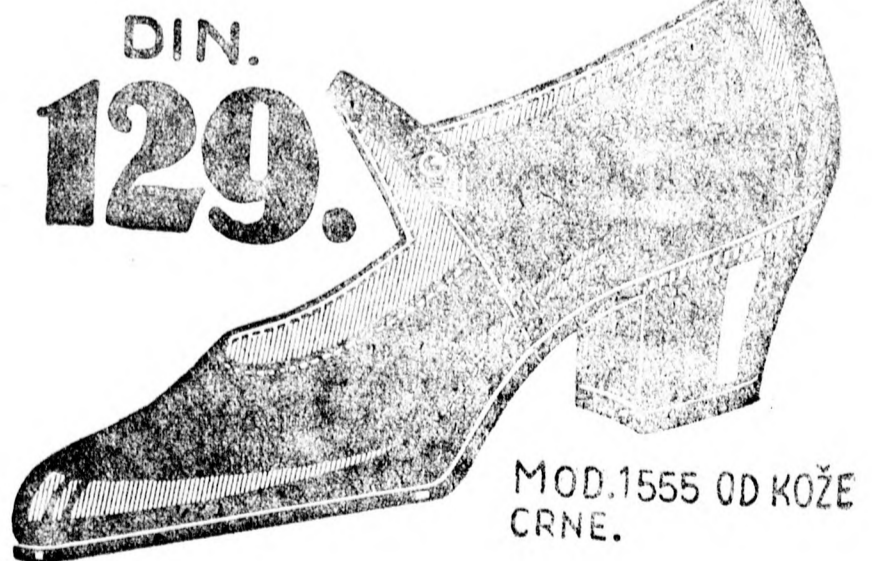
MOD. 1555 OD KOŽE CRNE.