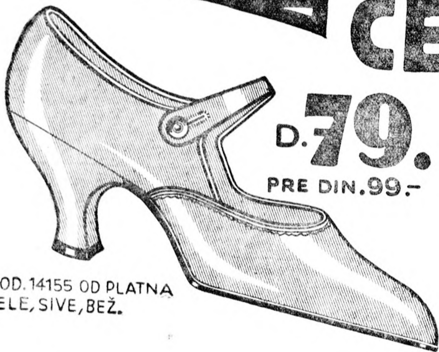
MOD. 14155 OD PLATNA BELE, SIVE, BEŽ.