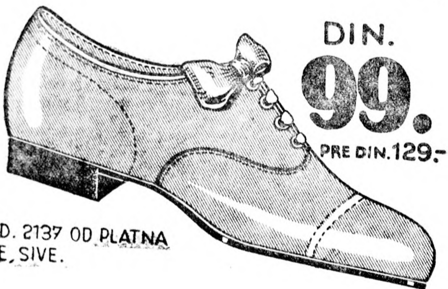
MOD. 2137 OD PLATNA BELE, SIVE.