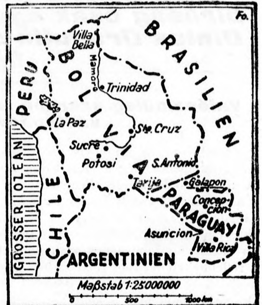
A „hadszintér” térképe

Lapazból jelentik: A Bolívia és Paraguay között fennálló régi gyűlölködés újabb határvillongássá fajult. Háromszáz emberből álló paraguay-i osztag átlépte a bolíviai határt és a 25 emberből álló határőrséget lekasabolta. Arra a hírre, hogy a paraguay-i csapatok átlépték Bolívia határát, a bolíviai külügyminiszter Ayalanak, Paraguay ügyvivőjének kikézbcsitette utlevelét. Ayalanaát fegyveres őrség kísérte a határig.