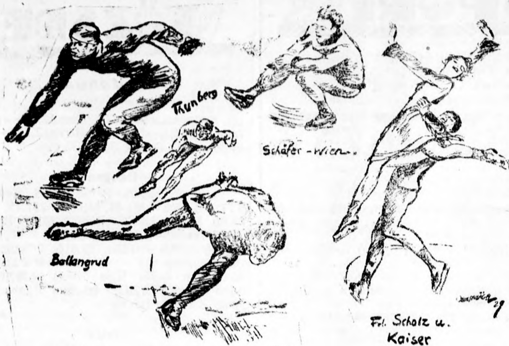
Thunberg (Finnország) világrekorder