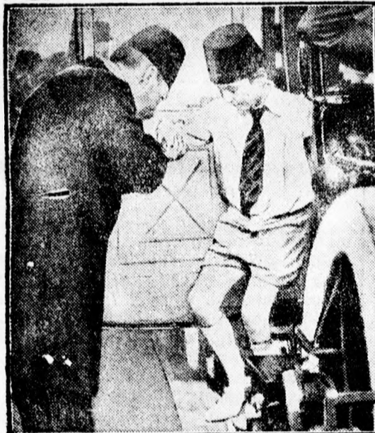
Egyiptom 9 éves trónörökösét kézcsokkal üdvözlö a miniszterelnök