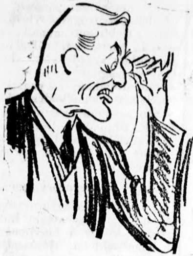
Chamberlain angol külügyminiszter