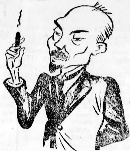
Adatschi japán követ

A Népszövetség hármass bizottságának tagjai, akiket azzal bízták meg, hogy dolgozzanak ki egy a kisebbségekre vonatkozó javaslatot és azt terjesszék elő a május 20-án ismét összeülő Népszövetségnek.