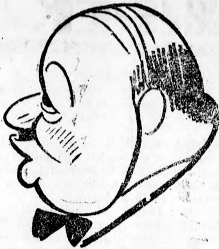
Quinones de Leon spanyol követ