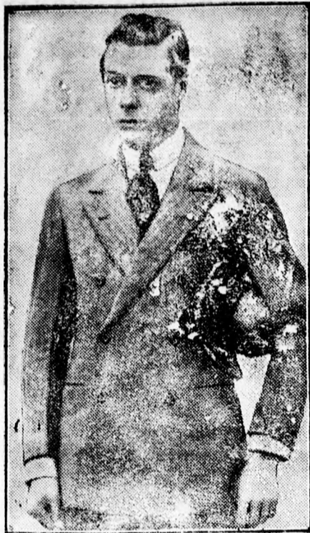
Albert walesi herceg

— Terjed a munkanélküliség Franciaországban. Párisból jelentik: Franciaországban egyre nagyobb méreteket ölt a gazdasági munkáskrisz. A francia munkaügyi miniszter tegnap Párisban felhívást tett közzé, amelyben felszólítja a Párisban lakó fiatal munkásokat és munkásnőket, hogy vállaljanak gazdasági munkát és keressenek alkalmazást azokban a megyékben, ahol a mezőgazdasági munkahiány már igen veszedelmes méreteket öltött.