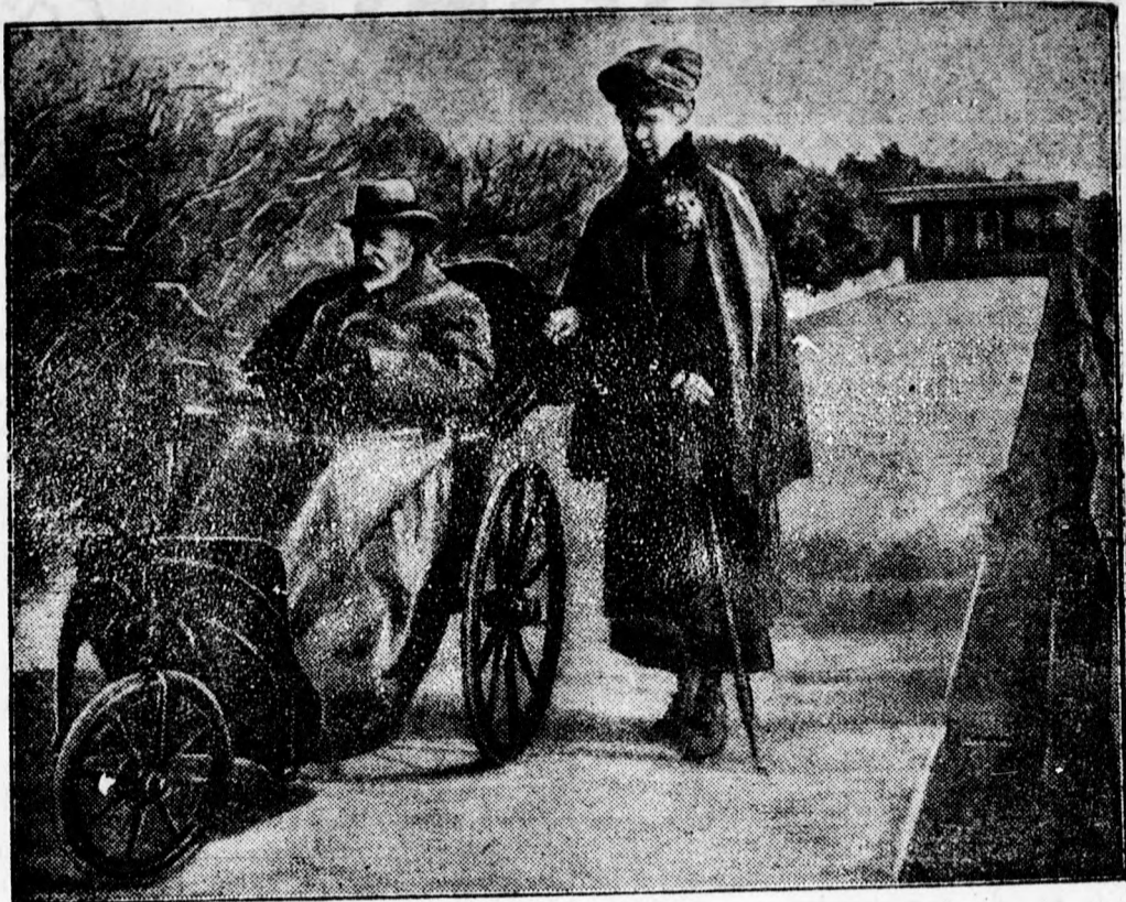
V. György angol király és Mary királyné a bognori villa kertjében. Miután a délangliai tengerparton már napsütéses nyhe idő van, az orvosok megengedték a királynak, hogy tolokocsiban sétautat tessen a villa kertjében