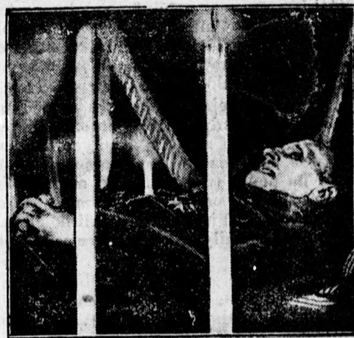
Foch marsall a ravatalon

A koporsót a család tagjai, a hatóságok képviselői és a vezérkar tisztjei kísérték el. Az ágyutalpra helyezett koporsó előtt egy szakasz vértess katona haladt. A Diadal Iv előtt elhelyezett ravatalnál a front-harcosok négy tisztje és cserkészek állanak diszörséget, a koporsó mellett két jezsuita páter imádkozik.