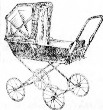
26-os sz. Din. 349