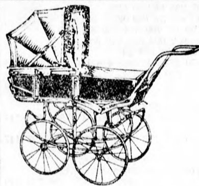
54-es sz. D. 649