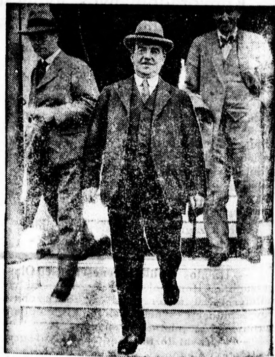
Henderson, az új angol külügyminiszter

Hát nem bájos dolog ez? — kérdi befejezésül a francia ujság.