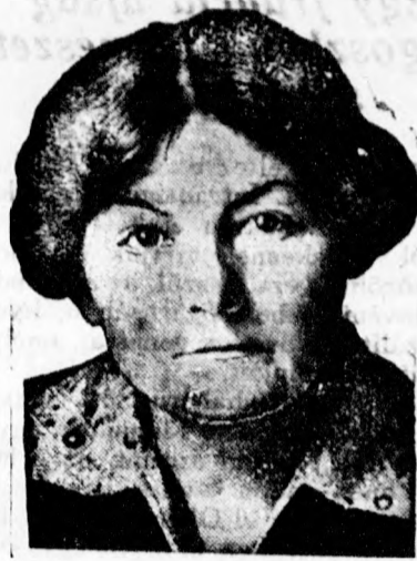
Miss Margaret Bondfield