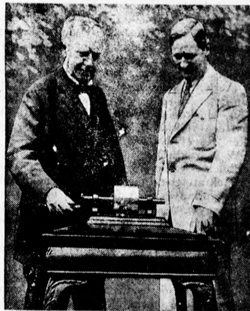
Edison és az első fonográf

Ötven évvel ezelőtt készítette Edison az első fonográfot, a gramofon őst.