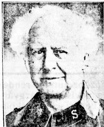
William Brammwell Both, az Űdvhadsereg volt parancsnoka 73 éves korában elhunyt.