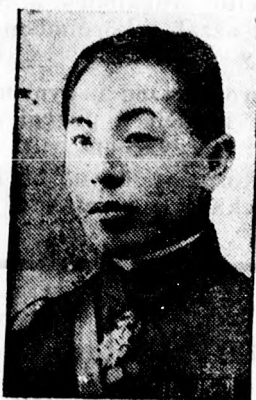
Csang-Csu-Liang a mandzsuri hadsereg főparancsnoka