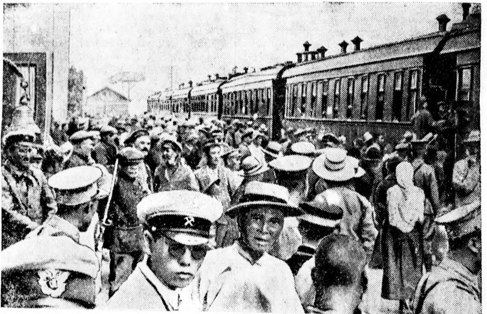
Menekülők — Mandsuti állomáson