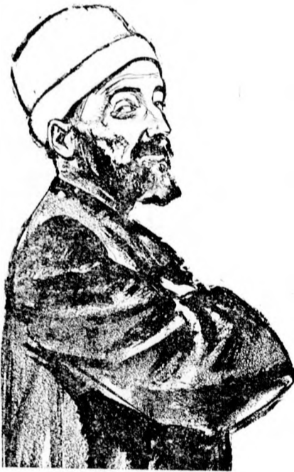
Heussen i Mufti, a jeruzsálemi legfelsőbb mohamedán tanács elnöke. A zsidók őt vádolják a palesztinai harc felidézésével.

Az arabok a gyilkosságok után fosztogatni kezdtek. A hatóságok most házkutatásokat tartanak, hogy az elrablott holmikát megtalálják. Egy házban három teherautóra való rablott dolgot találtak. A rablók ellen kiméretlenül fellépnek és sommás eljárást alkalmaznak ellenük.