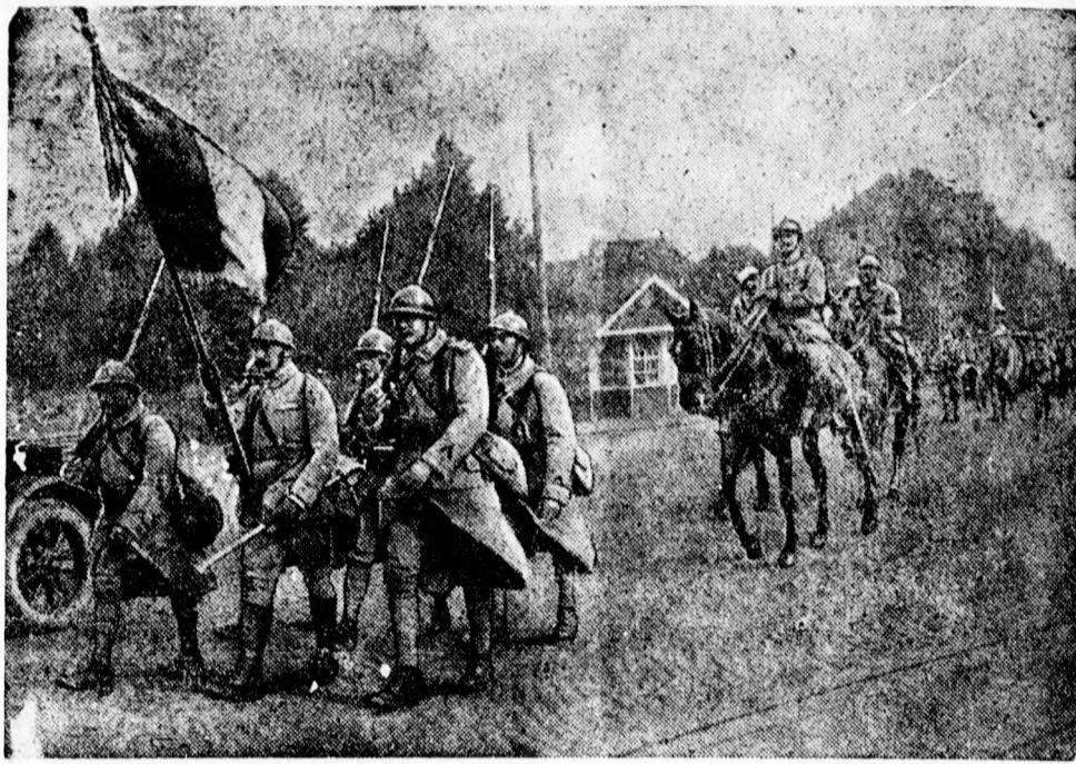
Képünk a francia csapatok Koblenz-ből való kivonulását ábrázolja.