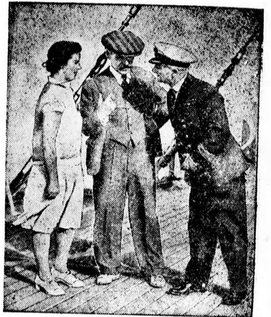
Ez a felvétel MacDonald amerikai utja közben készült.