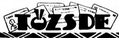
Az Izraelita Újév miatt a tőzsdék zárva.

Dwight Morrow, az Egyesült Államok mexikói nagykövete, Lindberghné apja, leánya javára egymillió dolláros trösztalapot létesített. A Lindbergh házaspár jelenleg még Délamerikában tartózkodik, ahol repülő utak létesítésén fáradoznak.