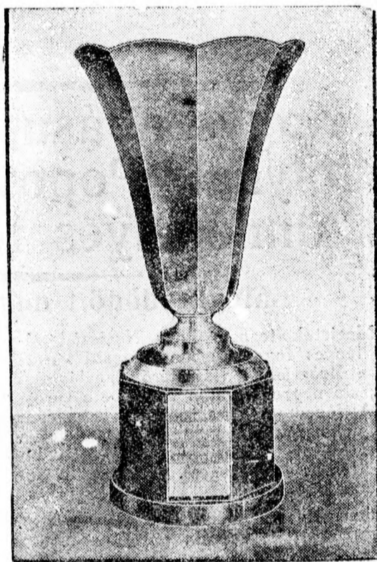
Hindenburg birodalmi elnök serlege, melyet a Tokióban járt német atléták győztes csapata számára ajánlott fel