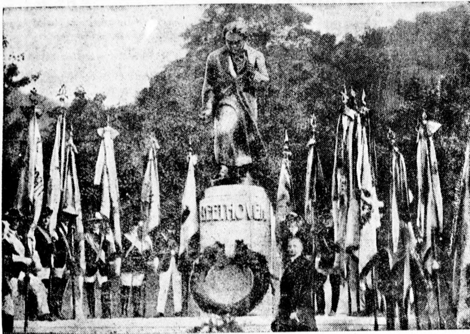
Karlsbadban a múlt héten leplezték le Beethoven szobrát. Képünk a diákszervezeteket mutatja az ünnepségen