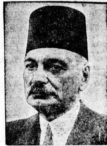
Adly Jegenh pasa

ODOL PÁTE DENTIFRICE tisztít — üdit — kiadós